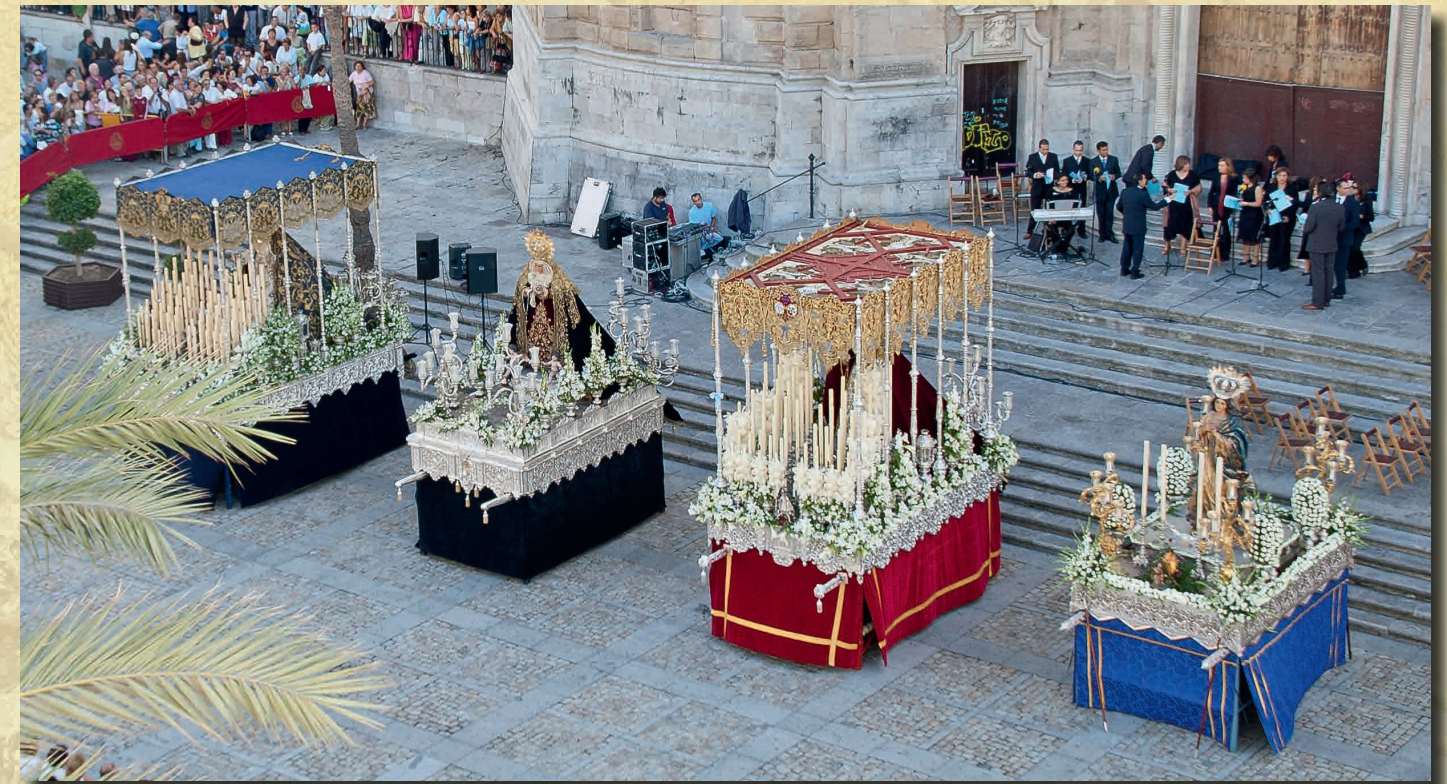
8 de octubre de 2005. Procesión Magna Mariana con motivo del 150 Aniv. del Dogma de la Inmaculada Concepción.