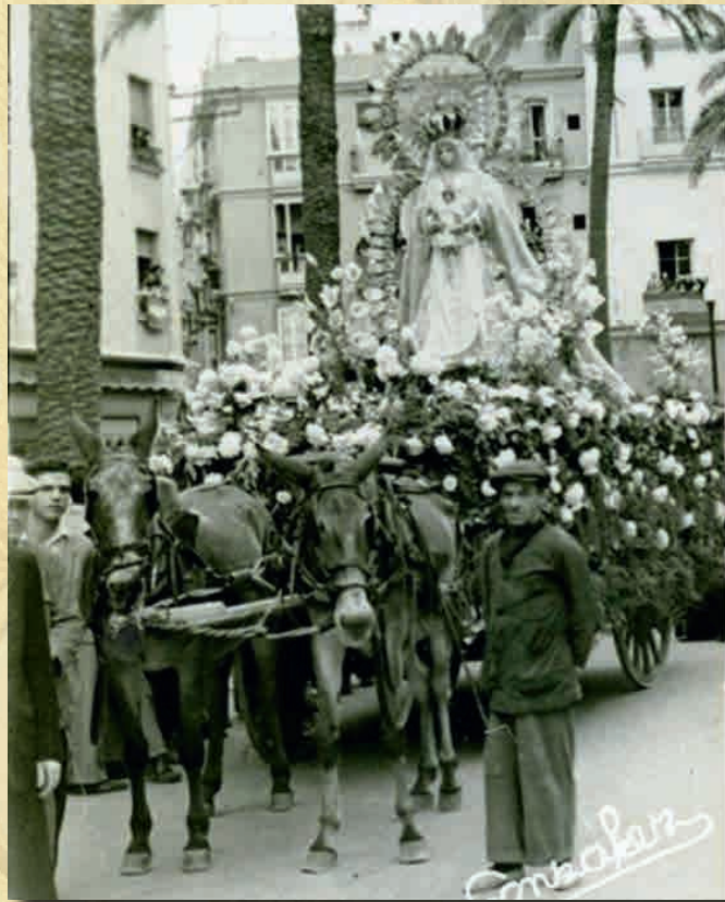
1 de noviembre de 1950. Procesión Magna Mariana con motivo de la proclamación del Dogma de la Asunción.