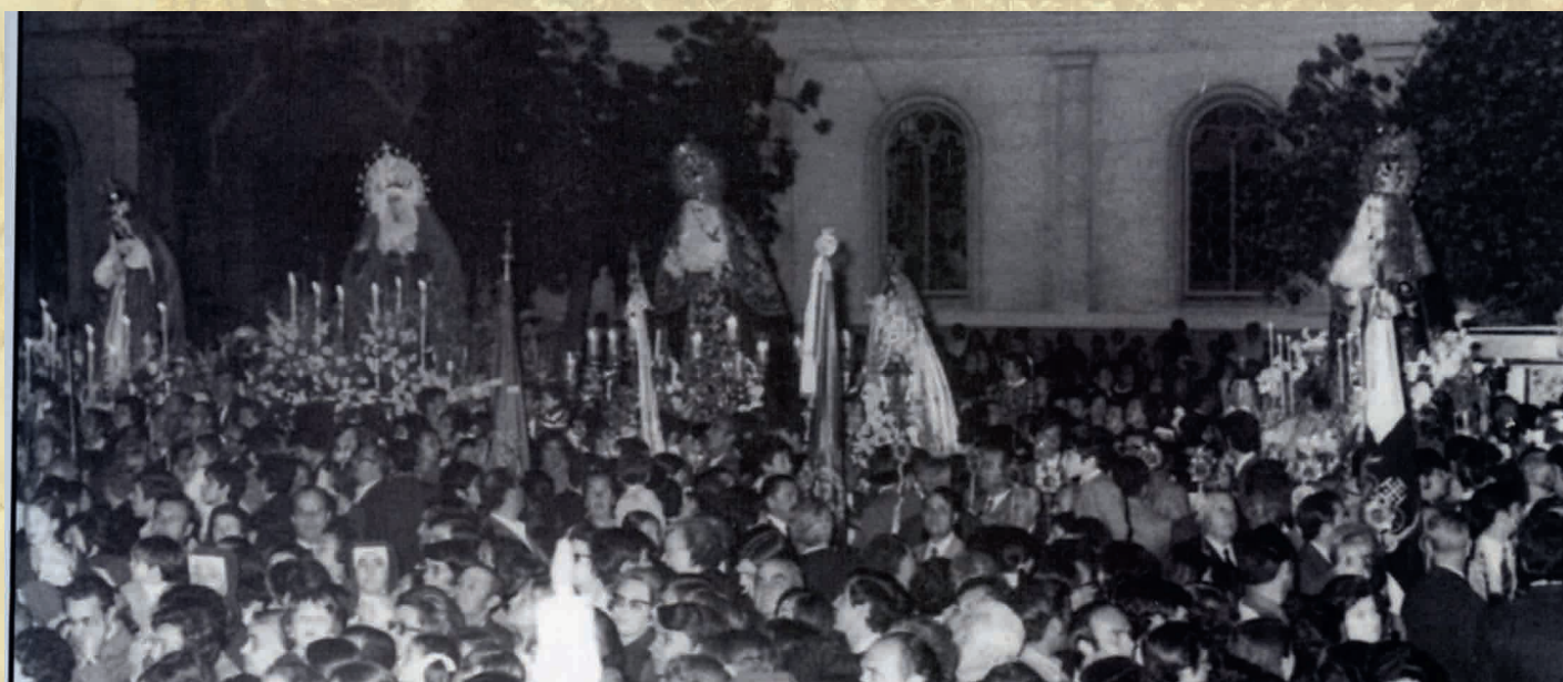
6 de mayo de 1972. Procesión Magna Mariana con motivo del 25 Aniv. de la Coronación Canónica de la Virgen del Rosario, Patrona de Cádiz.