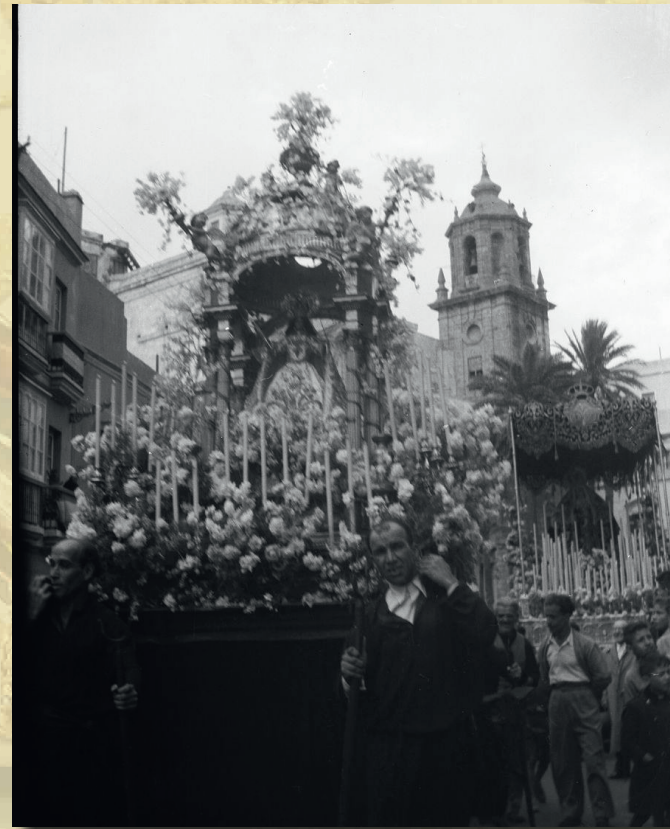
1 de diciembre de 1954. Procesión Magna Mariana con motivo del Centenario del Dogma de la Inmaculada Concepción.